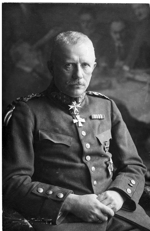
Vokietijos šeštojo rezervinio korpuso, veikusio Lietuvoje ir Latvijoje, vadas, Liepojos karinis generalgubernatorius gen. ltn. Rüdigeris von der Goltzas. Niu-jorkas, 1923 m.

nominių spaudimą evakuoti Vokietijos karinius dalinius iš Baltijos regiono 1919 m. antroje pusėje.